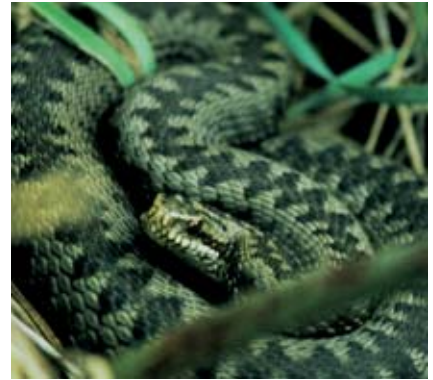
Die Kreuzotter ist wie alle Tiere zuerst vorsichtig und zieht sich vor dem Menschen zurück.

Sicher habt ihr auch schon von der Tollwut gehört. Als ich noch jung war, waren die Füchse in meinem Wald häufig von ihr befallen und haben dann, in seltenen Fällen, auch Menschen oder Hunde gebissen und diese gefährliche Krankheit übertragen. Dank der langjährigen Impfkationen mit Ködern spielt sie bei uns so gut wie keine Rolle mehr. Heute sind die meisten Gebiete tollwutfrei. Trotzdem soll man keine scheinbar zahmen oder kranken Wildtiere berühren, bei Bissen von verdächtigen Tieren muss man sofort zum Arzt.