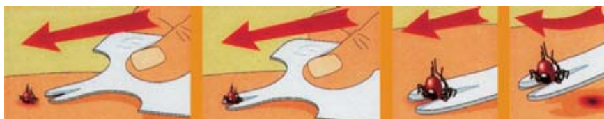
Mit der sogenannten Zeckenkarte ist eine Zecke schnell und richtig von der Haut entfernt.