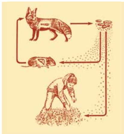
So kann der Kleine Fuchsbandwurm zum Menschen kommen.

Es gibt seit einiger Zeit immer mehr Füchse hier im Wald und diese zunehmend auch in der Nähe von Dörfern und am Stadtrand. Eigentlich mag ich sie ja gerne, diese schönen schlaun Tiere, wenn da nur nicht der Kleine Fuchsbandwurm wäre,