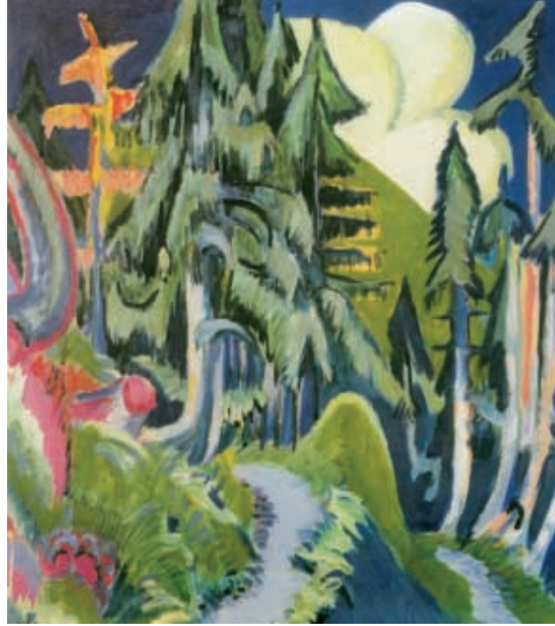
Ein Bild sich zu machen vom Wald war schon lange Bestreben des Menschen. Viele Künstler – bei weitem nicht nur Maler – schöpften aus der Ruhe und Freiheit im Wald die Kraft zu Kunstwerken für Auge und Ohr.

Im abwechslungsreichen literarischen Mischwald begegnen wir so unterschiedlichen Autoren wie Ludwig Ganghofer und Günter Grass. Und der literarische Wald steht nicht immer in einer realen Welt - er wurzelt beständig immer noch tief in unserer Seele, als Ort romantischer Freiheit.