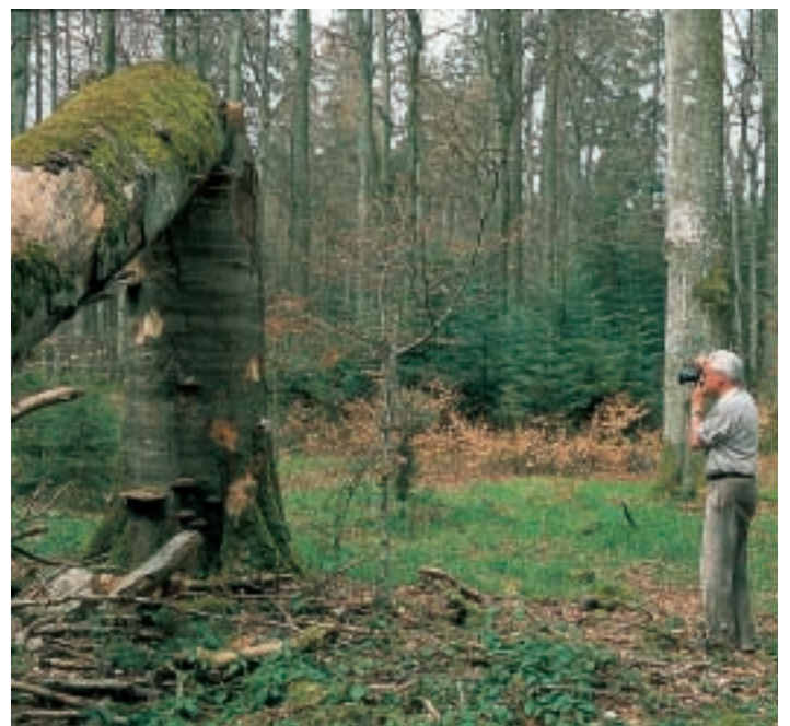
Die Kamera hat der Staffelei und dem Skizzenblock auch im Wald den Rang abgelassen. Dabei erweist sich besonders der naturnahe Wald unendlich reich an Motiven und wechselnden Stimmungen. Sie etwa im Stile eines Caspar David Friedrich einzufangen, ist jedoch sehr schwer.