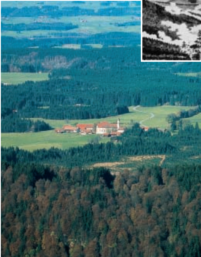
Eingebettet zwischen Wiesen und Wäldern liegt die berühmte Wieskirche am Rande der bayerischen Berge. Die gestalterische Kraft deren Rokokoausstattung wurde auch aus dem Wald geschöpft. Der Wald ist prägendes Element auch für die Kunst.